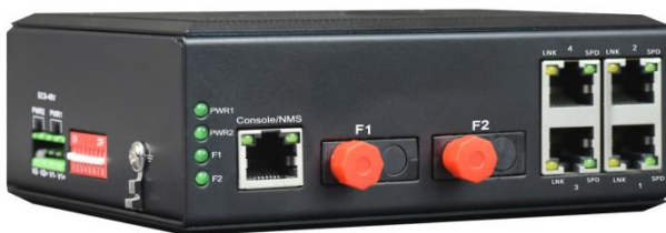
工业轨式千兆 2 光 4 电固定光模块 交换机