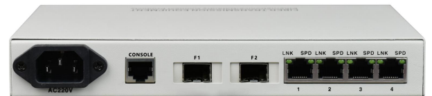
桌面式 千兆 2 光 4 电 交换机